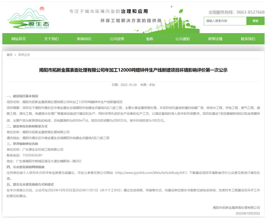
图 2.2-1 第一次公示网站截图