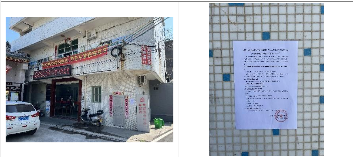
东面村第二次公示