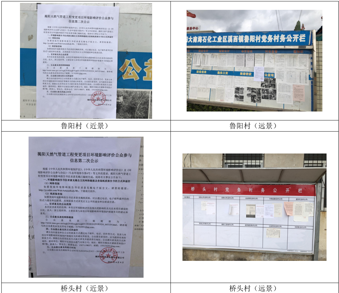
图 5-4 本项目征求意见稿环境影响评价信息张贴公示照片