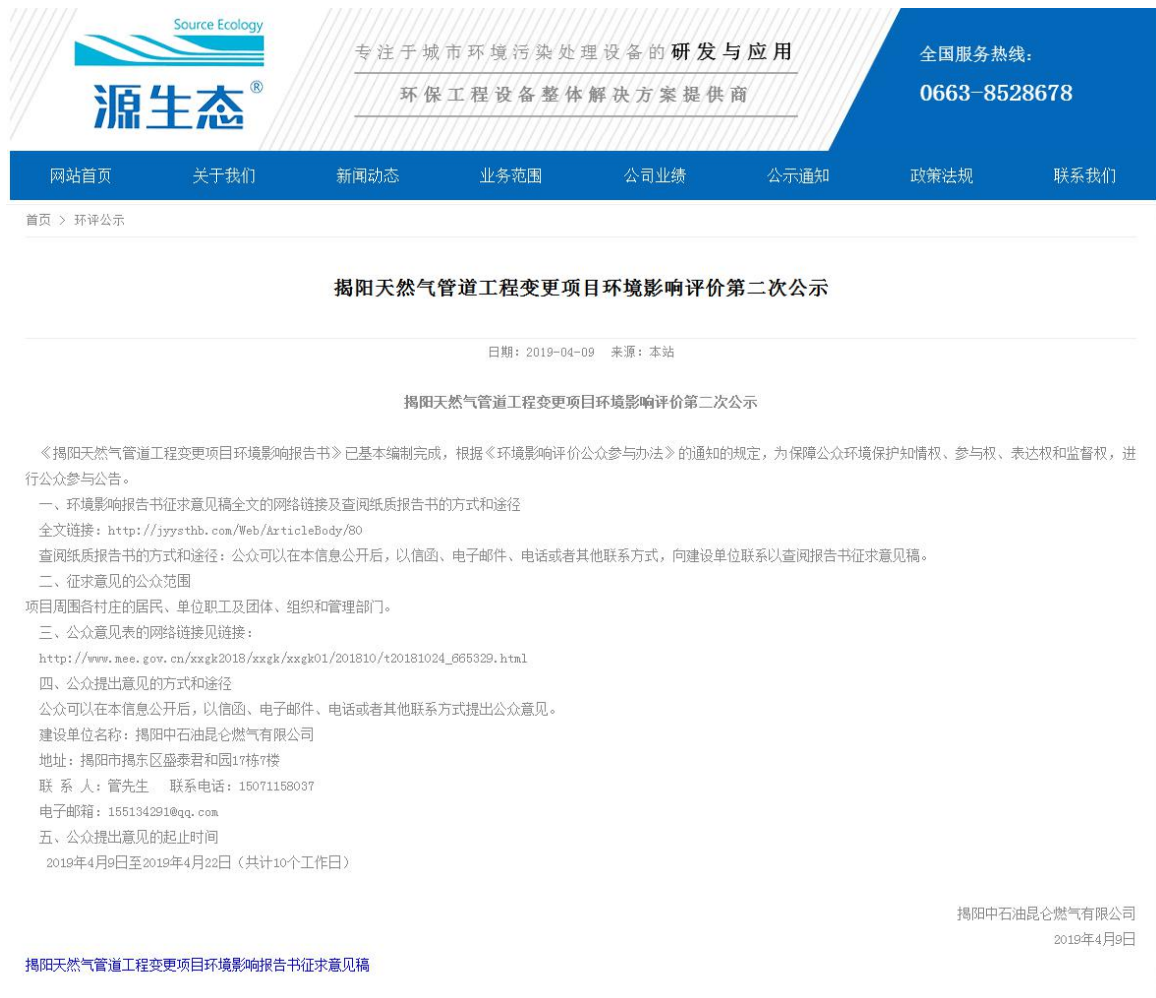
图 5-1 本项目征求意见稿环境影响评价信息网上公示截图