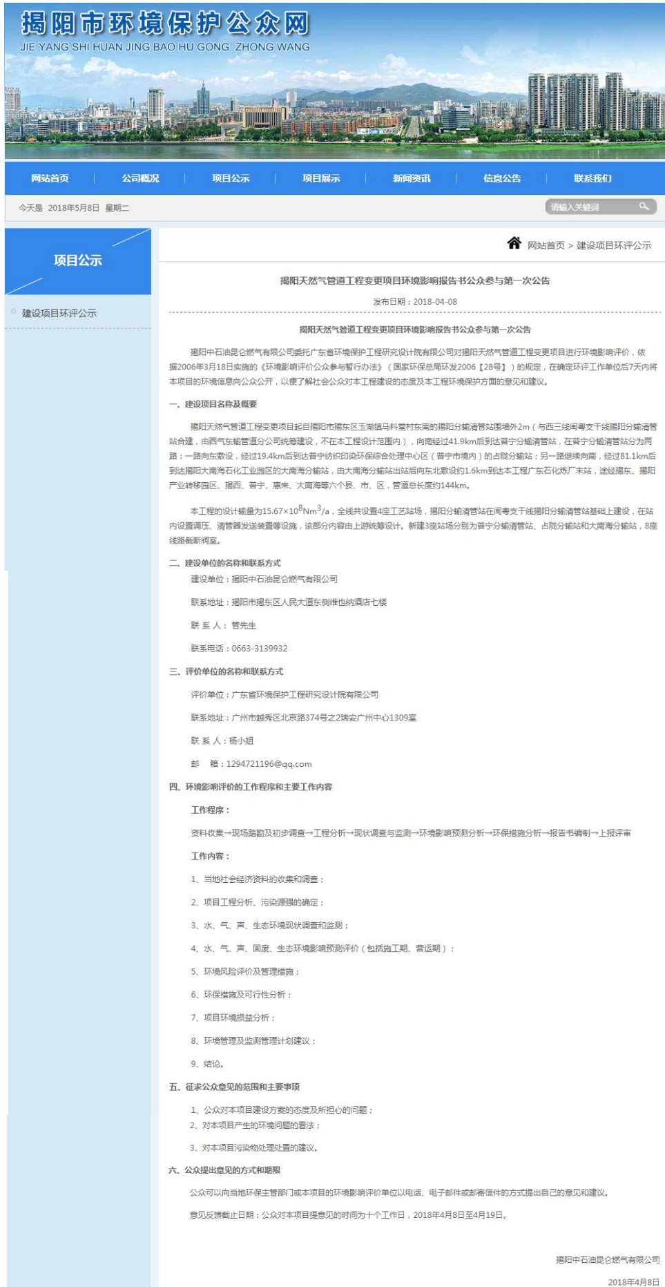
图 4-1 项目首次环境影响评价信息公示截图