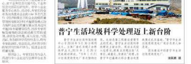
普宁生活垃圾科学处理迈上新台阶

普宁市召开“两会”，提出打造区域次中心，建设“商贾名城、美好普宁”。会议明确了普宁未来的发展目标和重点任务，包括加强基础设施建设、优化营商环境、提升城市品质等。