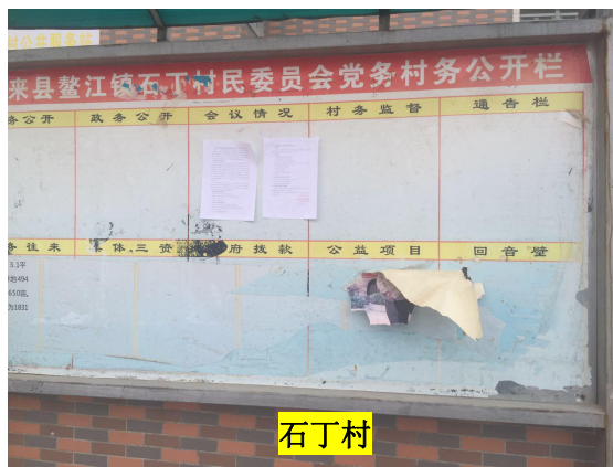
图 4-2 项目首次环境影响评价信息公开现场公示照片