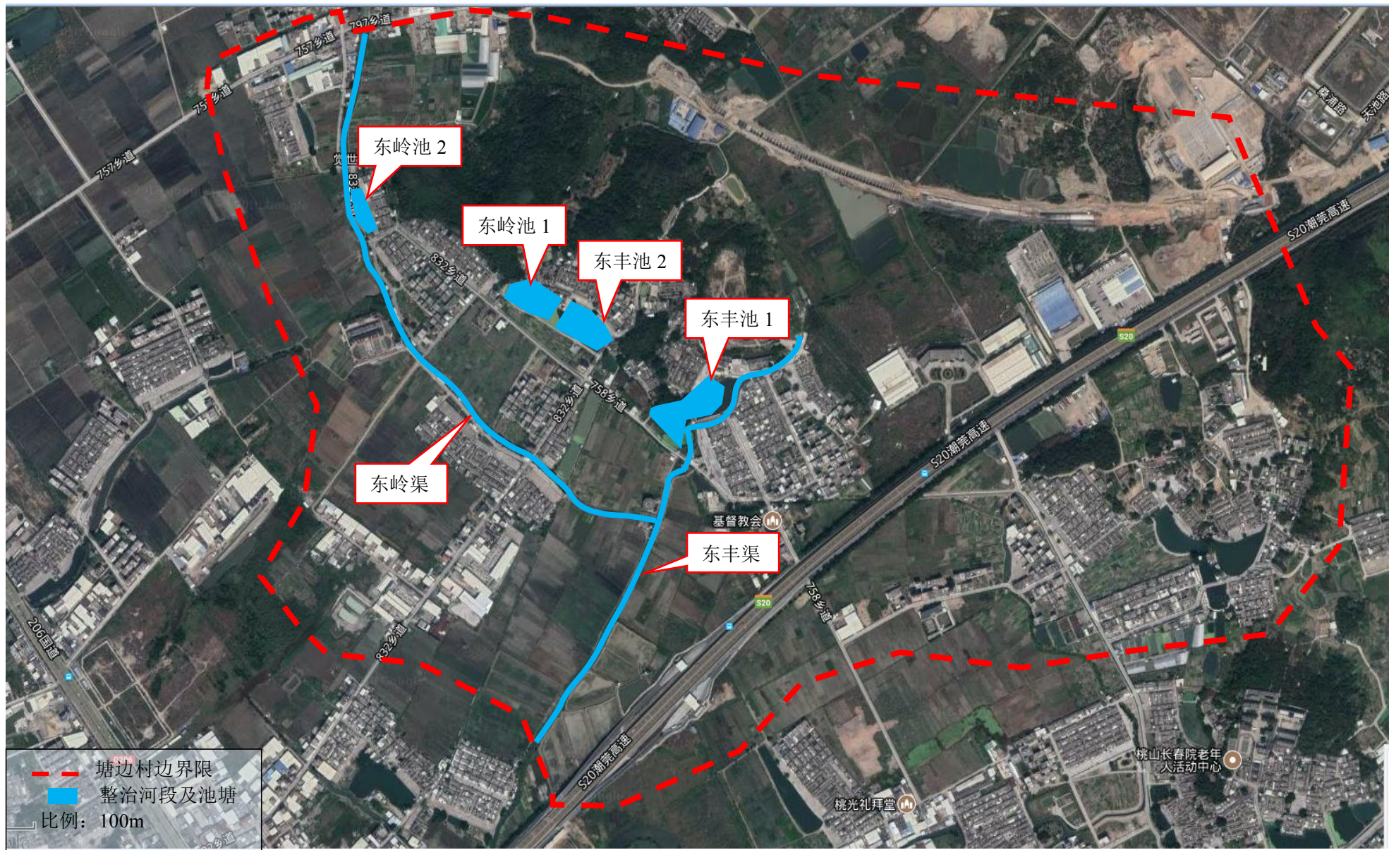
附图 2 项目河道环境整治河段示意图