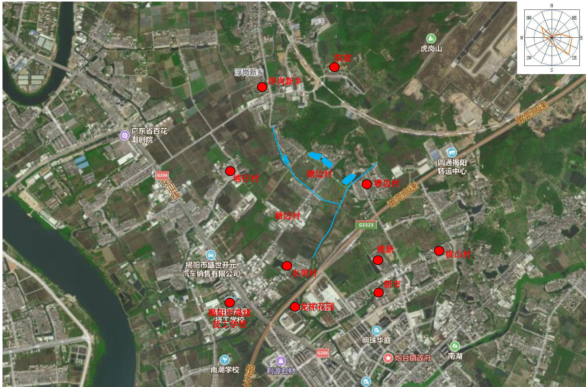
附图 4 项目周边敏感点图